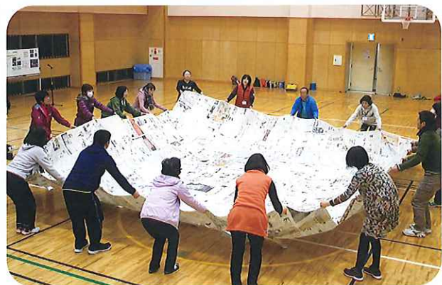
▲ つないだ新聞紙のじゅうたんで風を起こします