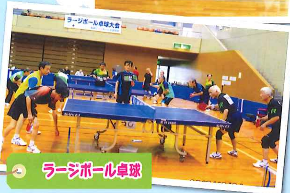
ラージボール卓球