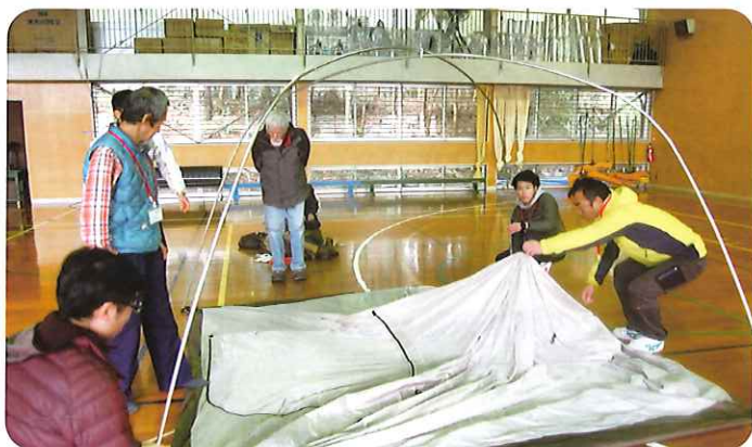
【キャンプ指導者養成講習会】 No.306

又一方では、様々な自然体験活動やアウトドアクッキング、クラフト活動等をとおしてキャンプの楽しさや醍醐味を伝える活動を進めながら、日本キャンプ協会が取り組んでいる「~社会の隅々までキャンプを届けよう~ “キャンプをより多くの人々に知ってもらいたい、体験してもらいたい”」を、アピールする事業を実施してまいります。