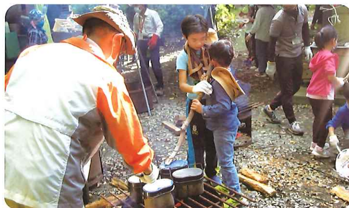
【共催事業「How to キャンプ」】 No.308