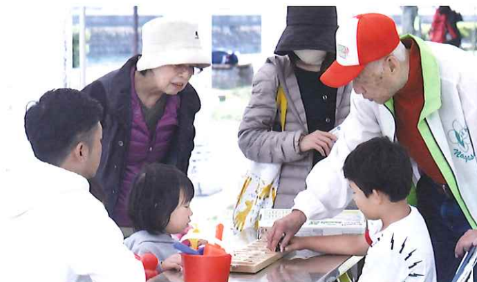
2019年スポレク祭inさせば 体験の広場の様子