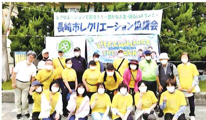
(2022/5/15 ウォークラリー大会)